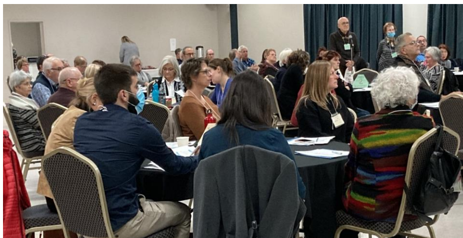
TCA-CA, Congrès « La Table en action » 17-11-2022 à St-Henri.